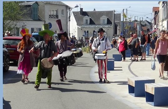
Yoopabloom orchestra lors des dominicales du Crotoy

Les prochains événements à venir pour le Crotoy seront Halloween le 31 octobre prochain et le marché de Noël au mois de décembre