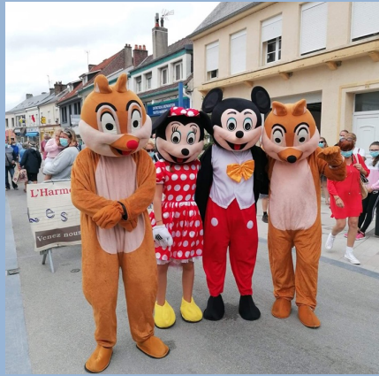
Mickey et les amis réunis au Crotoy