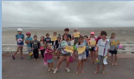
Les participants du concours de château de sable

Malgré la situation sanitaire actuelle et l'annulation de nombreux événements comme la fête de la Mer ou encore le feu d'artifice, la municipalité via le service animation a fait en sorte d'organiser des événements comme :