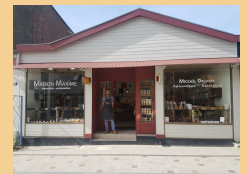
Vitrine du magasin au rucher de la baie

La municipalité souhaite bonne chance à ces nouveaux commerces qui en appelleront d'autres.